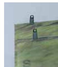
eingeklebter Metallstab mit Clipset